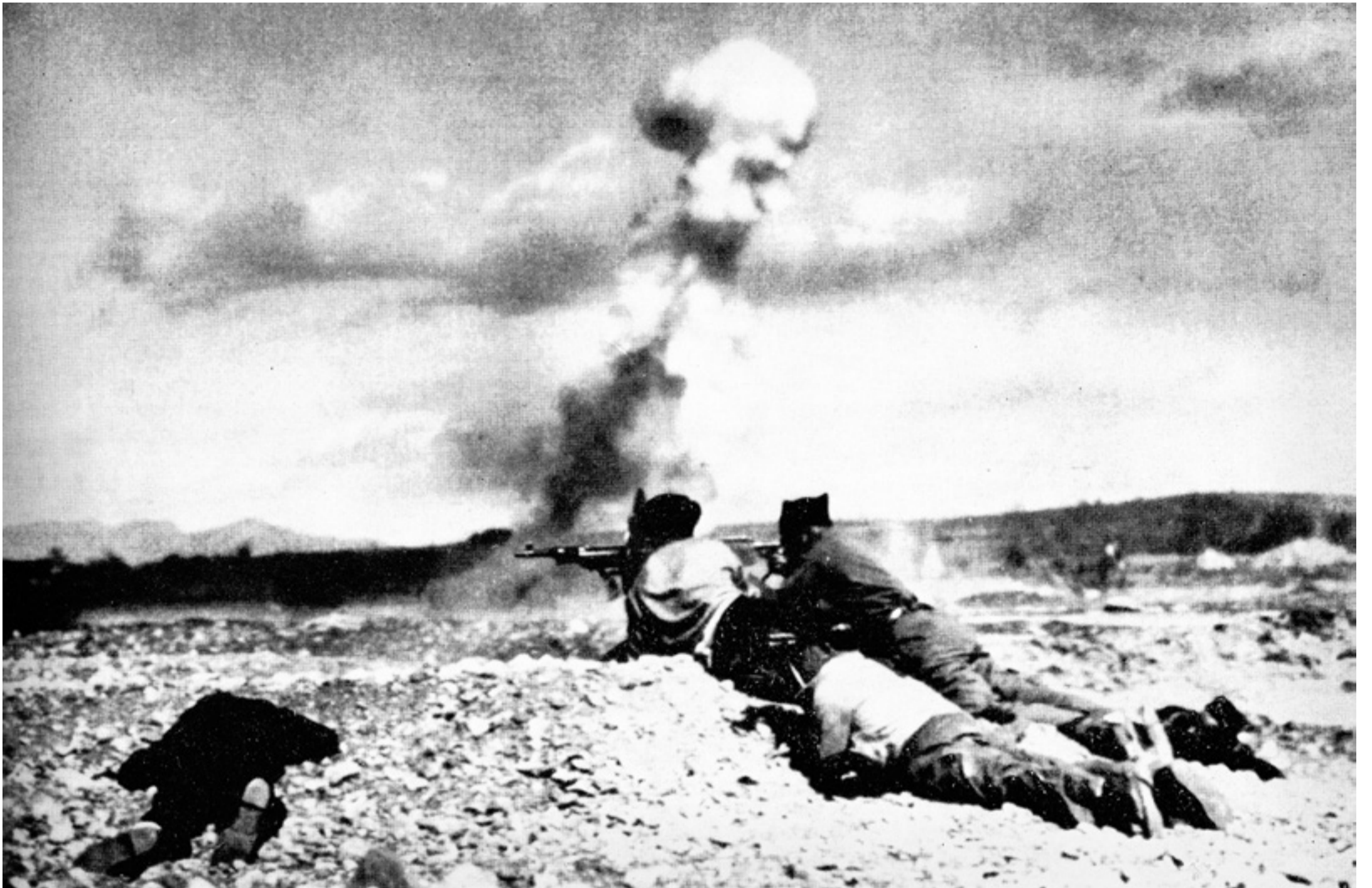
Die Abwehrkämpfe in der hügeligen Landschaft im Süden Madrids waren vor allem für die Internationalen Brigaden schwer und verlustreich – aber zunächst konnte die Front gehalten werden

Eine völlig unbekannte Brücke erlangte plötzlich Weltruhm. Sie war weder eine außergewöhnliche Ingenieurleistung noch besonders schön oder groß. Die Brücke von Arganda del Rey war eine einfache auf Betonpfeilern ruhende Stahlkonstruktion aus dem Jahre 1910. Militärisch gesehen hatte dieser Übergang über den Fluss Jarama südöstlich von Madrid aber eine strategische Bedeutung für den Kampf der Spanischen Republik gegen die putschenden, vom deutschen und italienischen Faschismus unterstützten Generäle.